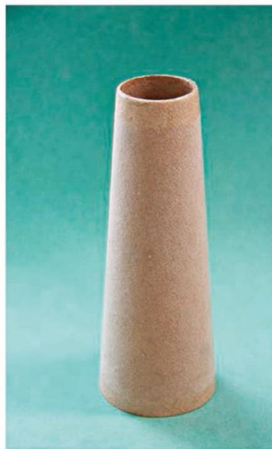
4°20 (59x32x170 мм)

Картонные конусы используются в текстильном производстве при намотке нитей и пряжи.