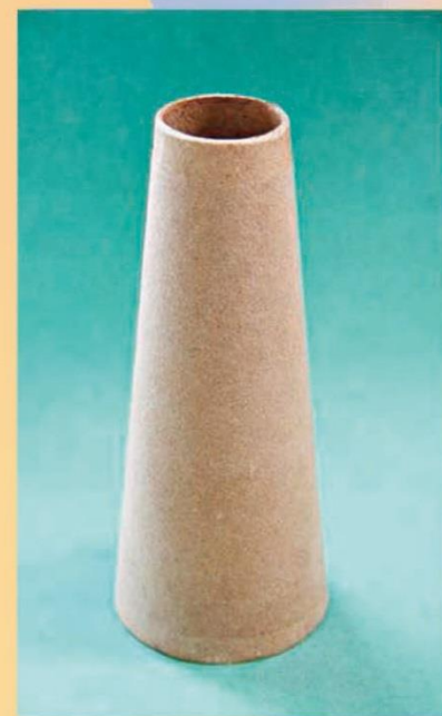
5°57 (68x33x170 мм)